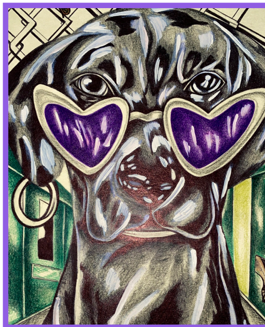
Creado por: Jose L.