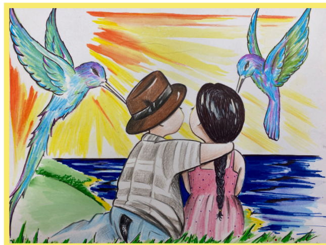
Creado por: Louie J.