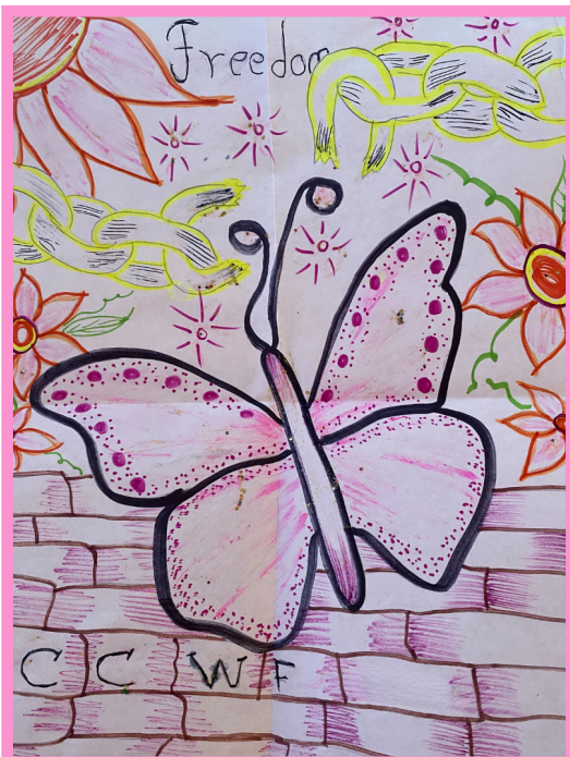
Creado por: Flor G.